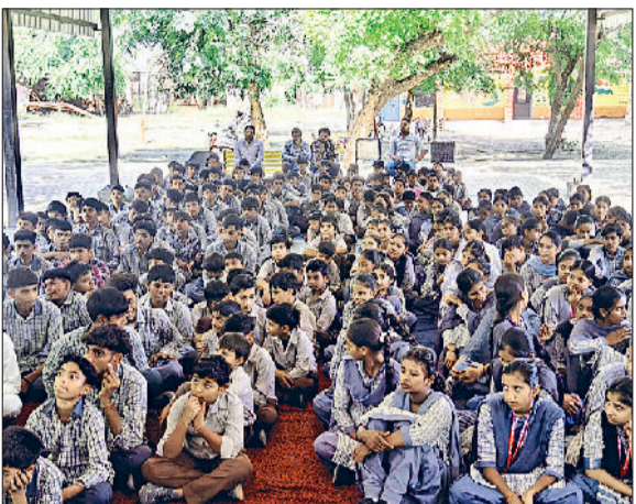
सिरसा। कार्यक्रम में भाग लेते विद्यार्थी।