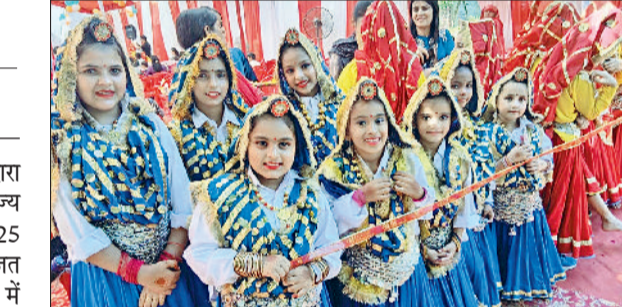
रतिया। जिला स्तरीय डांस प्रतियोगिता में भाग लेती डीएवी नागपुर की छात्राएं।

जिला बाल कल्याण परिषद द्वारा बाल भवन फतेहाबाद में राज्य स्तरीय बाल दिवस-2025 प्रतियोगिताओं के तहत आयोजित जिला स्तरीय प्रतियोगिताओं में डीएवी स्कूल नागपुर के विद्यार्थियों ने पहले दिन जमकर धूम मचाई। डीएवी नागपुर के विद्यार्थियों ने गुप डांस और सोलो डांस में ऐसी प्रस्तुति दी कि पूरा पंडाल तालियों से गुंज उठा। गुप डांस में डीएवी नागपुर की टीम ने जहां तीसरा स्थान