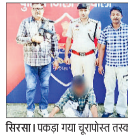
सिरसा। पकड़ा गया चुरापोस्त तस्कर।