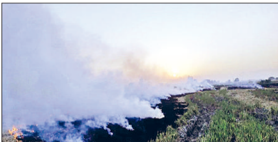
फतेहाबाद। पराली में आग के बाद उठता जहरीला धुंआ। (फाइल फोटो)

फतेहाबाद में 31 गांव येलो और 219 गांवों को ग्रीन जोन में रखा, रेड जोन में अभी जिले का कोई गांव नहीं