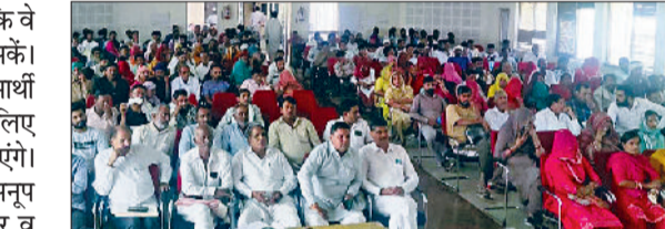
सिरसा। पंचायत भवन में पहुंचे आवेदक।

सिरसा। मुख्यमंत्री ग्रामीण आवास योजना-2 के द्वितीय चरण के तहत मंगलवार को स्थानीय पंचायत भवन में 100-100 वर्ग गज प्लॉटों के ऑनलाइन ड्रा निकाले गए। इस दौरान 2535 आवेदकों को ड्रा में शामिल किया गया। जिला परिषद के सीईओ डा. सुभाष चंद ने बताया कि मुख्यमंत्री ग्रामीण आवास योजना-2 के द्वितीय चरण के तहत 37 गांवों के जम्मेदार पत्र परिवारों को 100-100 वर्ग गज के प्लॉट के ऑनलाइन माध्यम से अलॉट किए गए हैं। उन्होंने बताया कि बड़ागढ़ा खंड के भादड़ा, भोवा, चकरिया, दाबा, झोरडरोही, कर्मगढ, मलड़ी, रोहण, सहाणी, सुखचेतन तथा थिराज गांव के पत्र परिवारों को मुख्यमंत्री ग्रामीण आवास योजना के तहत प्लॉट अलॉट किए गए हैं। इसी तरह डबवाली खंड के गांव बनवाला, कालुआना, लंबी, ऐलनाबाद खंड के किशनपुरा/दाणी जटान, मेहनखेड़ा में भी प्लॉट आवंटित किए गए हैं। नाथुसरी चौपटा खंड के गांव अरनियावाली, हकरियावाली, बरसरी, चाहरवाला, कागदाना, गिगोरानी, गुदियाखेड़ा, कुक्कडथाना, कुतियाणा, माखोसरानी, मोडियाखेड़ा, रामपुरा दिल्ली, रूपाणा, दड़बा खुर्द, शक्करमंदेरी व तेजियाखेड़ा में प्लॉट आवंटित किए गए हैं। ओढ़ा खंड के गांव घुकावाली, रानिया खंड के गांव गिदड़ा, जोधापुरिया, सिरसा खंड के गांव कुसुंभी, नेजाडैला कलां व बखुवाली के आवेदकों के लिए 100-100 गज के प्लॉट आवंटित किए गए हैं। उन्होंने बताया कि 37 गांवों में 2535 लाभपत्रों की पहचान की गई है और जिन गांवों में पंचायत की जमीन उपलब्ध थी, वहां लाभपत्रों को प्लॉट आवंटित कर दिए गए हैं। दूसरे फेज में 4388 प्लॉट अंत्योदय परिवारों को देने के लिए रखे गए थे। इस अवसर पर जिला विकास एवं पंचायत अधिकारी बलजीत सिंह व सभी बीडीपीओ, संबंधित विभाग के अधिकारी व आवेदक उपस्थित रहे।