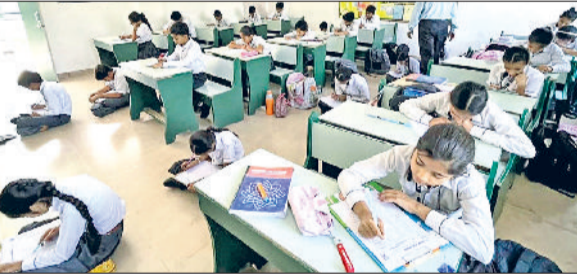
फतेहाबाद। भारत को जानो प्रतियोगिता में भाग लेते विद्यार्थी।