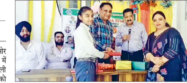
रानियां। प्रतियोगिता के विजेता बच्चों को सम्मानित करते हुए।